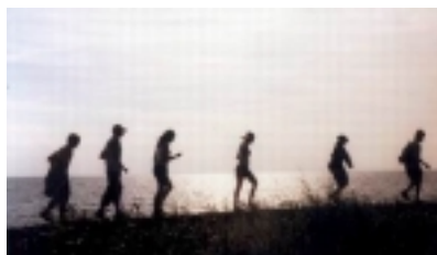
Wędrówka brzegiem Zatoki